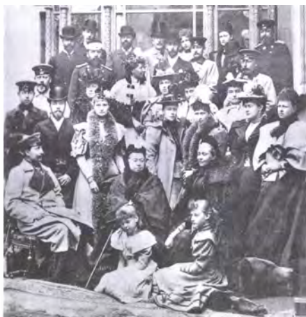
RODINNÁ FOTOGRAFIA S KRÁĽOVNOU VIKTÓRIOU UPROSTRED AKO „DYNASTICKOU BABIČKOU EURÓPY“. VÝSADU SEDIET NA TEJTO FOTOGRAFII MALI LEN TRI AUTORITY: SAMÁ KRÁĽOVNÁ, JEJ NAJSTARŠIA DCÉRA A NEMECKÝ CÍSAŔ VILIAM II. FOTOGRAFIA VZNIKLA PRI PRÍLEŽITOSTI 75. NARODENÍN KRÁĽOVNEJ VIKTÓRIE 24. MÁJA 1894.

Keď sa na verejnosť dostala správa, že kráľovná zomiera, celá krajina sa ponorila do smútku. Väčšina obyvateľov zažila na tróne len Viktóriiu a jej smrť na nich pôsobila neprirodzene, s kráľovnou odišla jedna epocha.