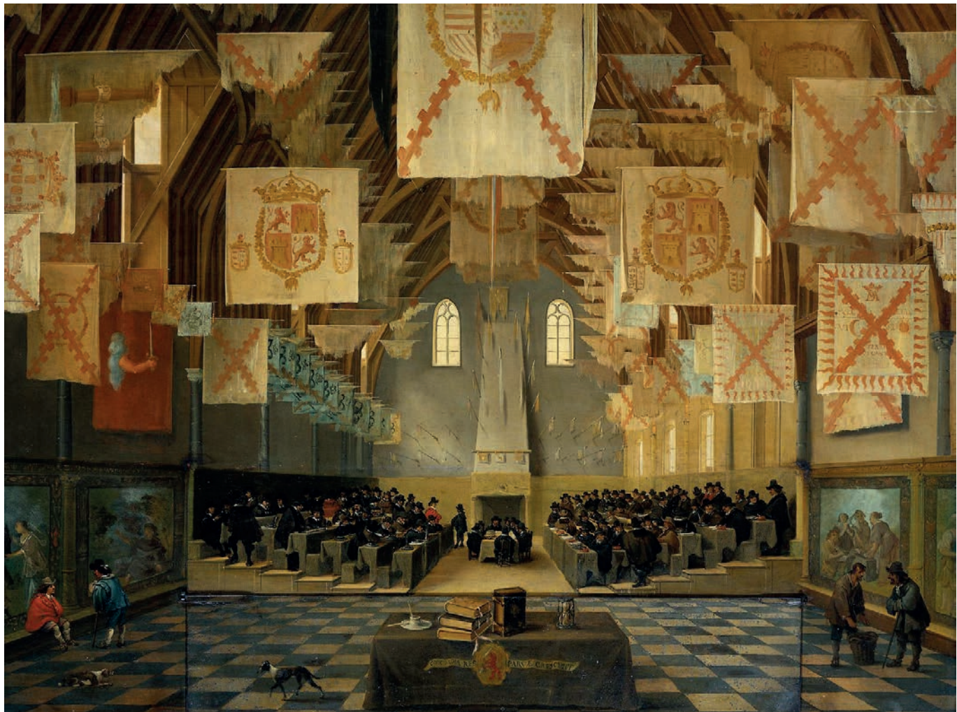
Zasadnutie nizozemských generálnych stavov v Ridderzaale (1651)

Zdroj: Wikimedia Commons / Anthonie Palamedes