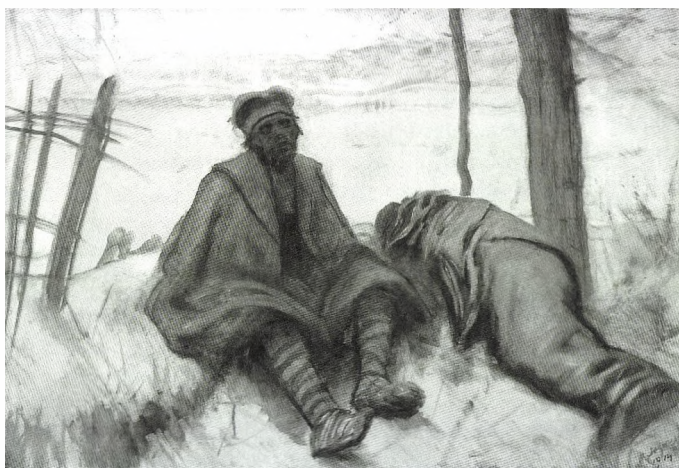
V SRBSKU (1914)

dým srdcom. “ V tom roku vystavoval v tej istej, vtedy už slávnej galérii v centre Paríža svoje obrazy aj známy impresionista Alfred Sisley. Zo 146 vystavených obrazov predal iba zopár, pričom tlač toto podujatie úplne ignorovala. Úspech menej známeho maliara zo Slovenska (Uhorska) vystupuje vo svetle týchto udalostí ako viac než významný fakt.