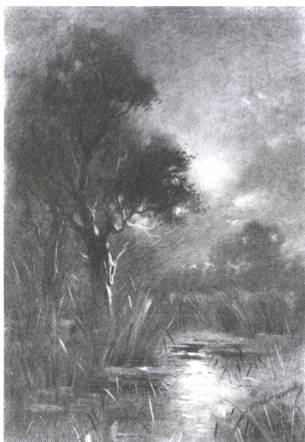
VEČERNÁ KRAJINA (1892)

Roku 1877 Ladislav Medňanský načas Francúzsko opustil. Odniesol si však mimoriadne cenné skúsenosti. Dá sa povedať, že sa stal už hotovým krajinárom. Mnohoraké umelecké dianie v Paríži a jeho okolí mu ponúkalo výber z početných hnutí a smerov. Z nich si zvolil tie, ktoré boli jeho umeleckému zámeru najbližšie. Barbizonské chápanie krajiny a tomu zodpovedajúci spôsob maľby kulminovali v jeho tvorbe ešte dlho do konca 80. rokov 19. storočia.