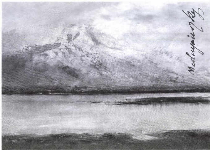
TATRANSKÁ KRAJINA (OKOLO 1890)

V rokoch 1896 – 1897 navštívil Medňanský Paríž posledný raz. V Galérii Georgea Petita usporiadal samostatnú výstavu. Hoci mal už 46 rokov, bola to jeho prvá a zároveň posledná parížska výstava. Znamenala skutočný prelom v jeho tvorbe. Boli tu vystavené obrazy tulákov, vydedencov spoločnosti, bedárov a bezdomovcov, ktoré ohúrili širokú verejnosť. Dobové časopisy a denníky nešetřili slovami chvály vyslovenými na jeho adresu: „ Medňanský je centrom, okolo ktorého sa točí na výstave každý talent “, „ je to veľký básnik, ktorý udáva základný tón – starešina so striebornými vlasmi a s mla-