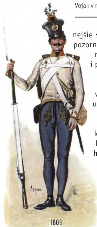
Vojak v roku 1809

nejšie sa zapísať do pozornosti armádného velenia i panovníckeho dvora. A tak, keď sa v novembri 1777 uprázdnil post veliteľa 31. pešieho pluku, 37-ročného Beňovského vymenovali za plukovníka a veliteľa pluku, v ktorom z h o d o u okolností práve pred 20 rokmi na-