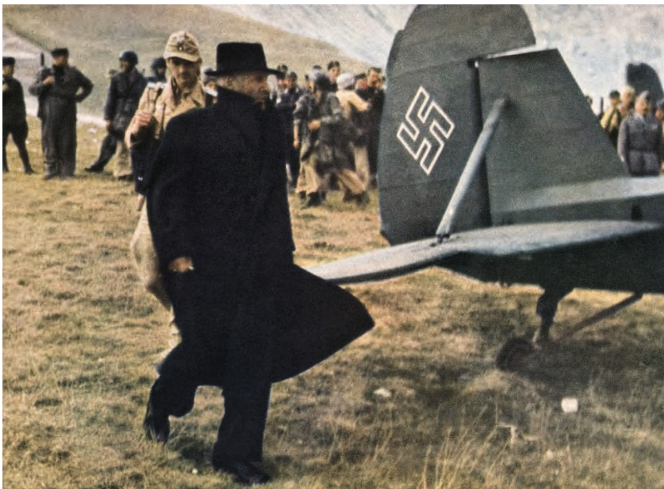
Mussolini pri nástupe do lietadla Fieseler Stork po svojom oslobodení Signal, 2. 11. 1943