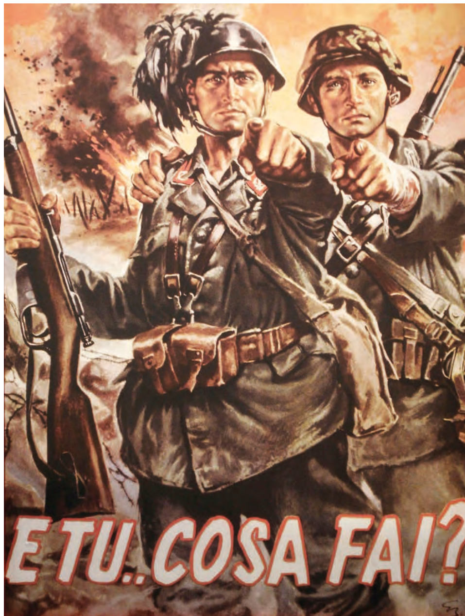
A Ty ... Čo robíš? Taliansky propagandistický plagát (Salò, 1944)

V predvečer Vianoc 1943 sedel bývalý minister zahraničných vecí fašistického Talianska, zať Benita Mussoliniho, gróf Galeazzo Ciano, vo väzení. Čakajúc na svoj trest smrti premýšľal nad osudom Talianska, o jeho úlohe vo vojne a do svojho posledného denníkového záznamu si napísal: „Podle mého názoru počala italská tragédie v srpnu r. 1939 (...) Neexistoval podle mého názoru žádný důvod, abychom se vážali na život a na smrt s osudem nacistického Německa.“ (Ciano, 1948: 515)