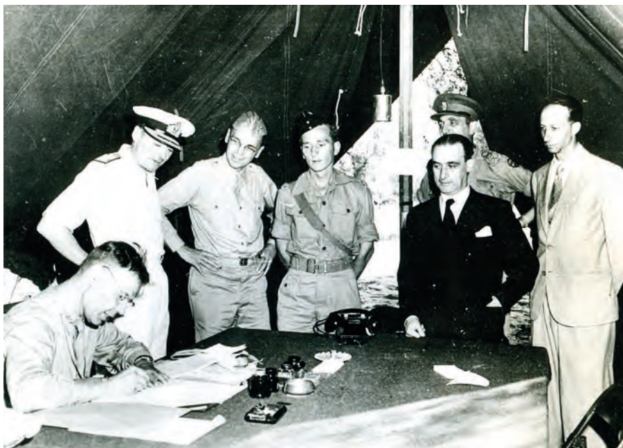
Dohoda o prímerí (Cassibile, 3. 9. 1943)

8. septembra talianska vláda oznámila ústami svojho šéfa maršala Badogliá, že Taliansko bezpodmienečne skladá zbrane. (...)“ V súvislosti s nacistickým Nemeckom sa vytváral naratív, v ktorom sa tvrdilo, že ríšske vedenie tento obrat nijak nezaskočil. Talianske zámery jeho členovia prezieravo odhadli a ešte v predstihu dokázali zabezpečiť opatrenia na stabilizovanie ofenzívnych operácií, a to aj v prípade, že Taliansko podpíše separátne prímerie: „Kapitulácia sa označuje za zradu talianskeho kráľa a cisára a jeho ministerského predsedu na nemeckom spojencovi a na talianskom národe. (...) Z dobre informovaných berlínskych kruhov na Wilhelmstrasse sa však oznamuje, že tento krok kráľa a maršala Badogliá neprekvapil ríšsku vládu a Nemecko urobilo všetky bezpečnostné opatrenia, potrebné na zaistenie Nemecka a jeho spojencov a na pokračovanie vo vojne až do konečného víťazstva. (Taliansko kapitulovalo, 1943: 1) V denníku Gardista sa preexponovanou rétorikou dokonca písalo o „najväčšej podlosti v dejinách“. (Najväčšia podlosť, 1943: 1)