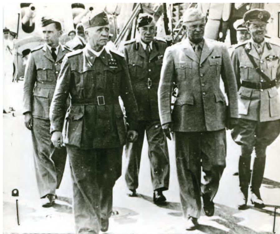
Pietro Badoglio s americkým generálom Dwightom D. Eisenhowerom na palube britskej bojovej lode Nelson