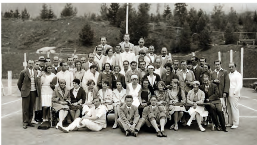
Medzinárodný turnaj v tenise Karpatského spolku vo Vysokých Tatrách (1928)