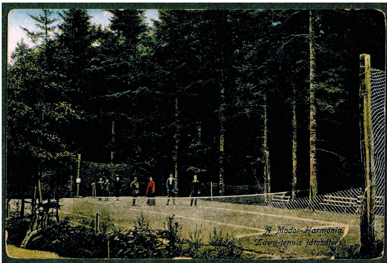
Pohľad na tenisové ihrisko v Modre-Harmónii (1917)

Hoci tenis patrí na Slovensku do kategórie najpopulárnejších športov dodnes nemá ucelene spracovanú svoju históriu. Príčiny môžeme hľadať najmä v povojnovej situácii. Predstavitelia nového režimu mu dali nálepku buržoáznej aktivity, a tak sa biely šport dostal na okraj záujmu športového hnutia. Až začiatkom sedemdesiatych rokov, keď prišli prvé medzinárodné úspechy, ktoré komunistický režim v Československu súrne potreboval, bol postupne zobratý na milosť. Skôr ako sa budeme venovať prvým krokom tenisu na Slovensku, pripomeňme si jeho počiatkový vývoj a cesty, ktorými prišiel k nám.