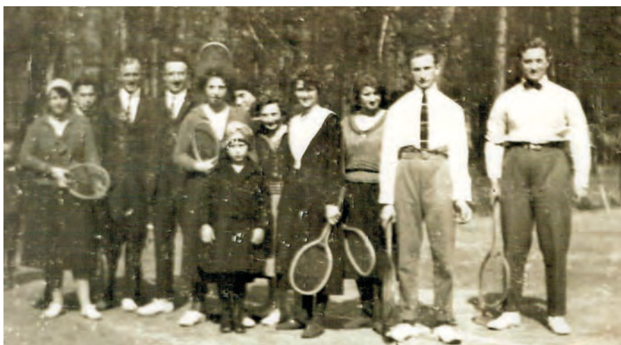
ŠK Makabea Liptovský Mikuláš (1924)