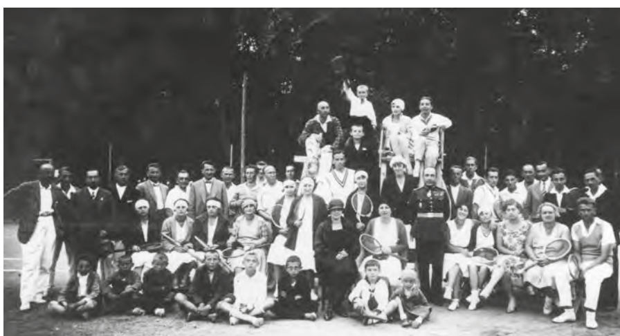
Lawn-tenisová sekcia SČD Nitra (1937)