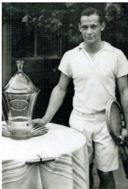
Ladislav Hecht – najúspešnejší tenista Slovenska

územia Maďarsku, nútený odchod časti obyvateľov českej národnosti a napokon vylúčenie obyvateľov židovského pôvodu zo spoločenského života znamenalo, že z prosperujúceho športového odvetvia zostalo len torzo. Tenis sa hral len v Bratislave, Žiline a Banskej Bystrici. Aj tieto kluby museli v snahe o udržanie činnosti koncentrovať vo svojich radoch hráčov zo širokého okolia. Ďalší vývoj tenisu najlepšie naznačuje skutočnosť, že trvalo viac ako štyridsať rokov, než sa tenis na Slovensku mohol opäť tešiť z hráča prvej svetovej desiatky.