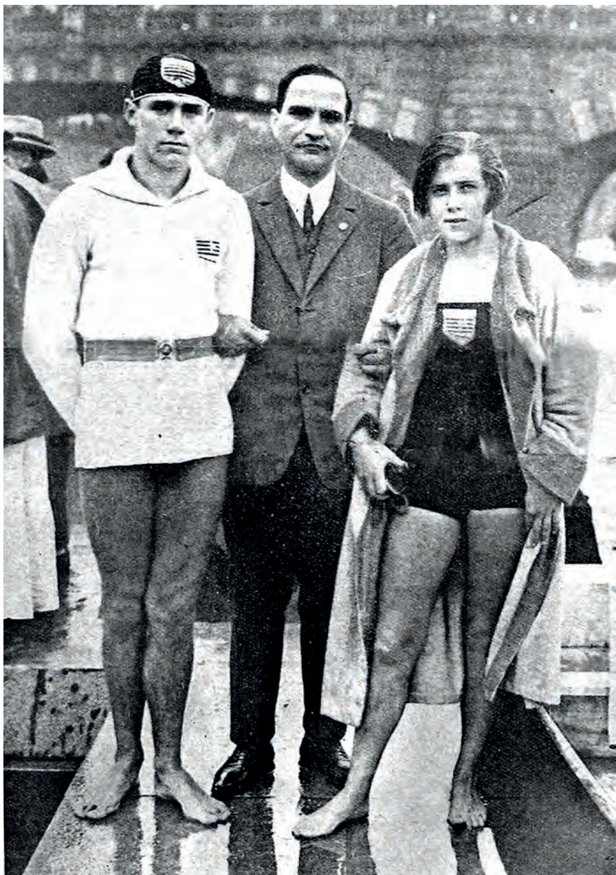
Súrodenci Messingerovci – majstri ČSR (1926)