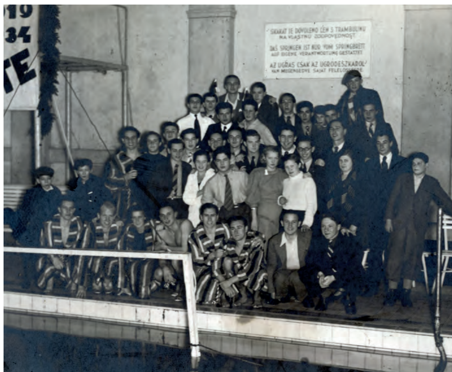
Jubilejné plavecké preteky bratislavského PTE v kúpeľoch Grössling (1934)