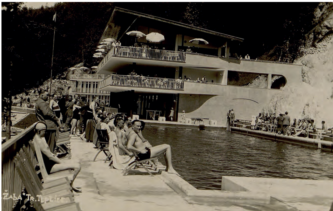
Kúpalisko „Zelená žaba“, Trenčianske Teplice (1937)

Plávanie patrí do kategórie športov, ktoré na Slovensku nemajú ucelene spracovanú históriu. Najmä počiatková etapa organizovaného plávania predstavuje biele miesto. Na rozdiel od iných športových aktivít, ktoré na Slovensko boli importované v druhej polovici XIX. storočia, v prípade plávania takýto medzník nie je možné stanoviť. Všeobecne je zaužívané spájať vznik organizovaného plávania na Slovensku s medzivojnovým obdobím. Či je tomu skutočne tak a prečo rekonštruovanie počiatkov plávania na Slovensku je pomerne náročné sa pokúsime ozrejmiť v našom príspevku. Rovnako ako dať odpoveď na otázku, prečo bolo plávanie jediným odvetvím, ktorého spolky zo Slovenska boli schopné konkurovať klubom spoza rieky Morava.