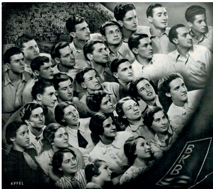
Plavci Bar Kochby Bratislava (1936)