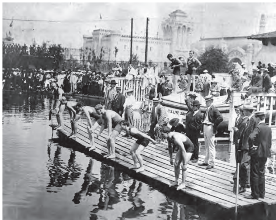
Zoltán Imrich Halmaj (Halmay), prvý zľava – olympijský víťaz (1904)