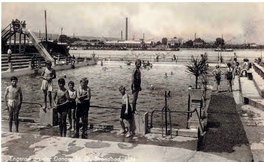
Plaváreň LIDO (1937)