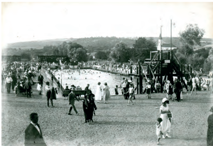
Gajdove kúpele (1925)

Po vzniku nového štátu začali české športové zväzy v duchu nových pomerov prijímať názov československý a prenášať svoje pôsobenie aj do východnej časti spoločného štátu. V tomto prípade, ale organizačný vývoj prebiehal podľa iného scenára. V Čechách pred vojnou nemali plavecké sub-